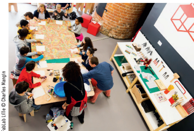
FabLab Lille