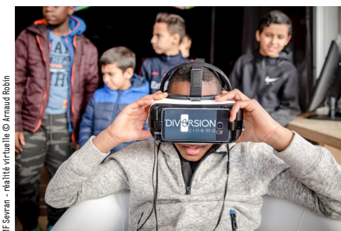
MF Sevrans - réalité virtuelle