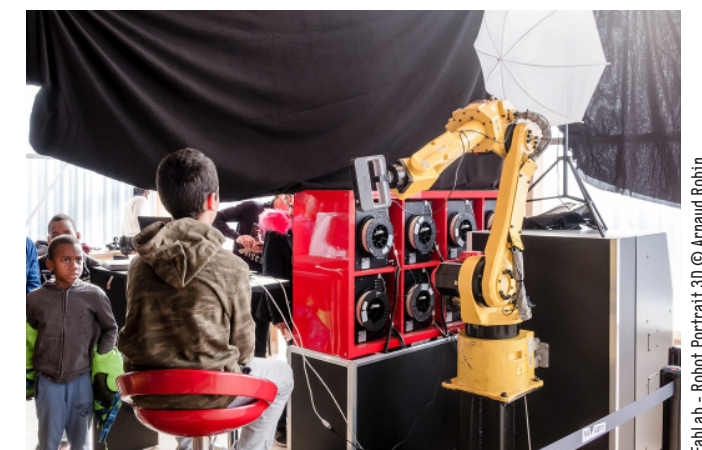
FabLab - Robot Portrait 3D