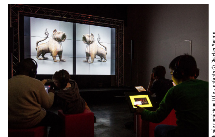
Musée numérique Lille - enfants